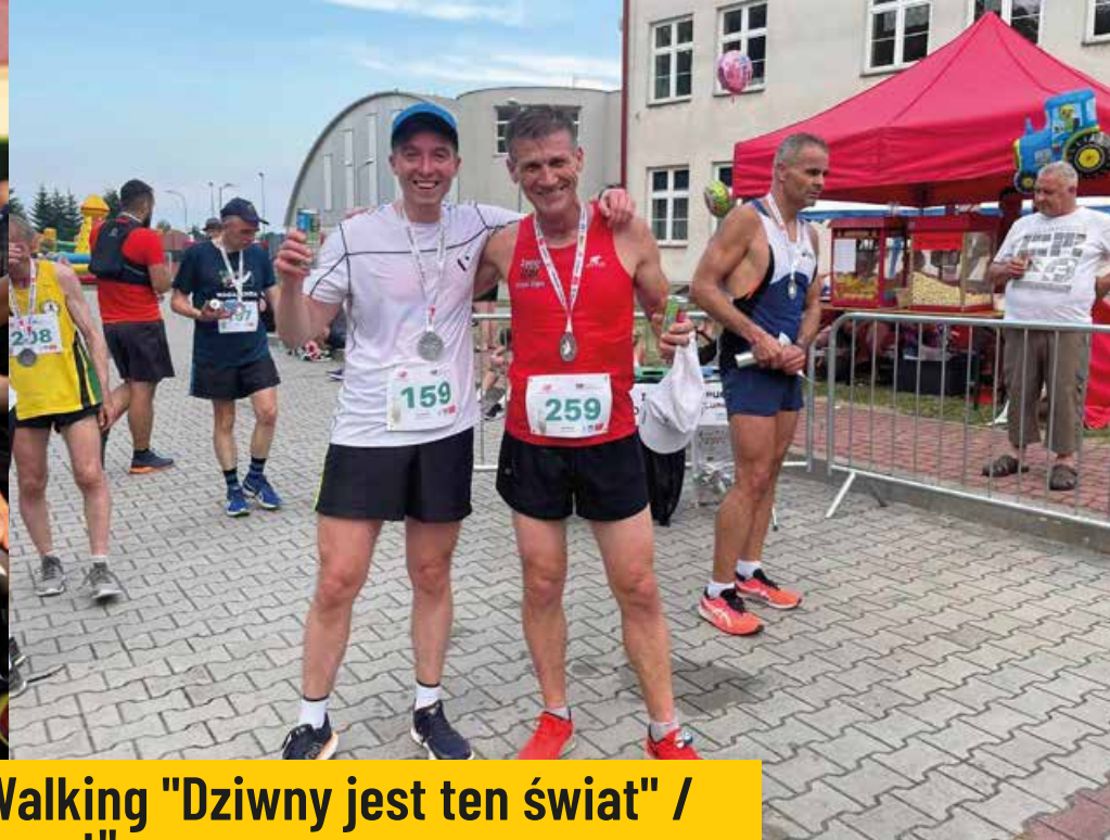
8 Bieg Czterolistnej Koniczynki i Nordic Walking "Dziwny jest ten świat" / 8 Beh štvorlístka a chôdza "Toto je divný svet"