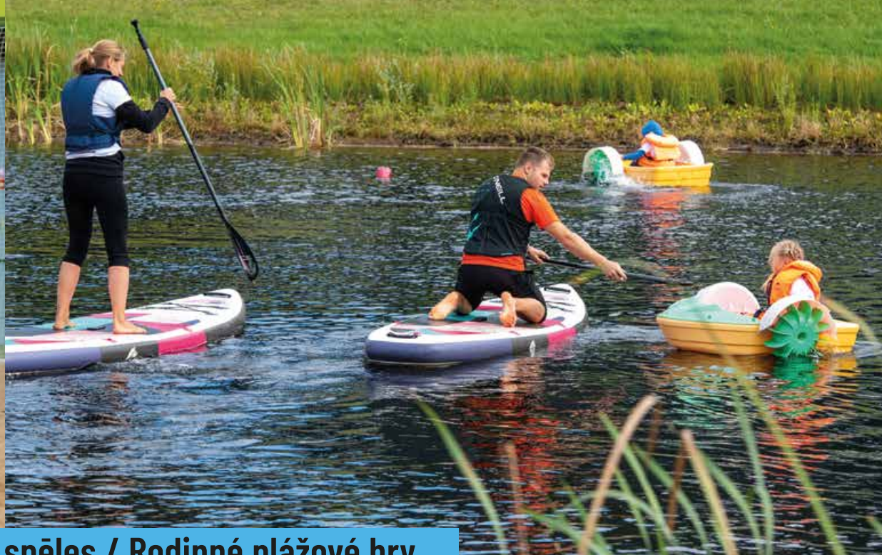
Ģimeņu pludmales spēles / Rodinné plážové hry