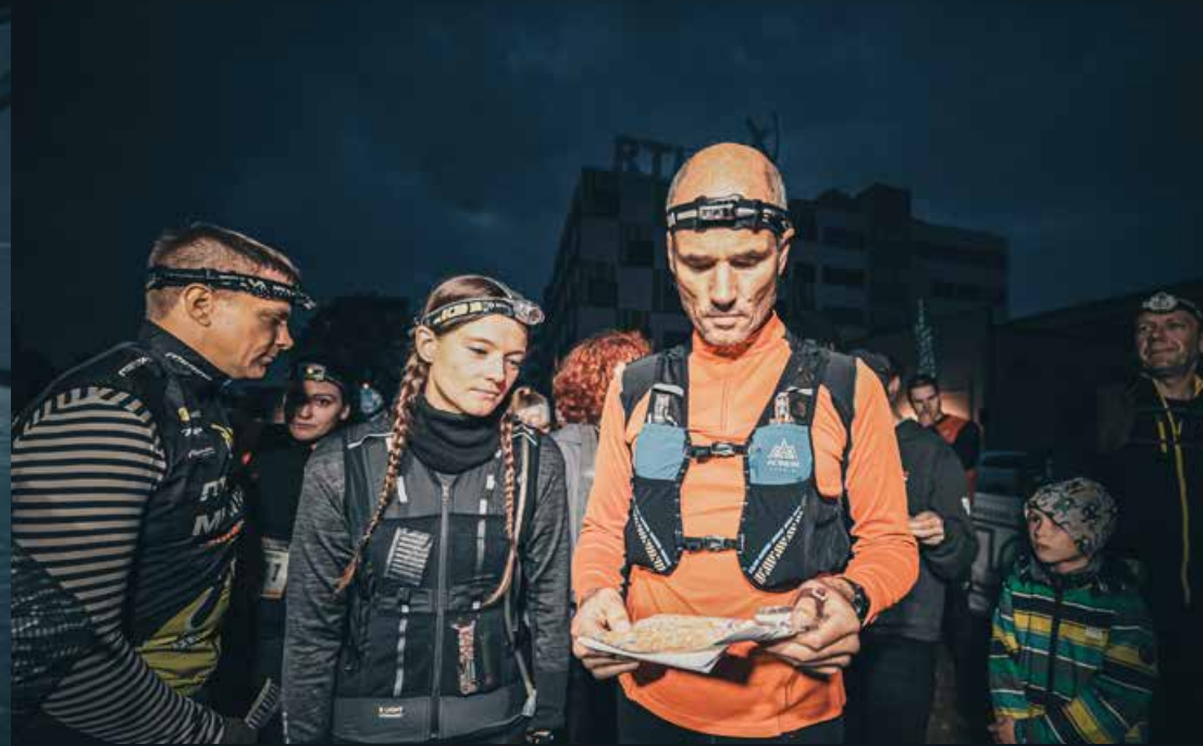
Rīgas Orientēšanās nakts / Nočny orientāčny beh Rigou